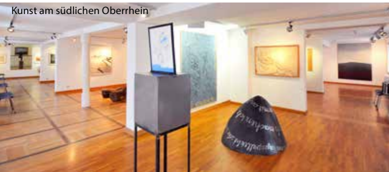
Kunst am südlichen Oberrhein